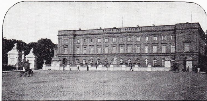
Bruxelles. — Palais des Académies.

De tout quoi il appert que notre cerveau semble doué d'une capacité d'absorption sans limites et que la matière qui le compose, ainsi que les phénomènes dont elle est le théâtre, n'est pas